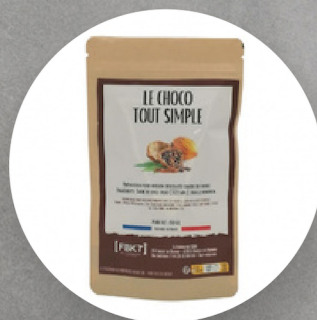
CHOCO TOUT SIMPLE